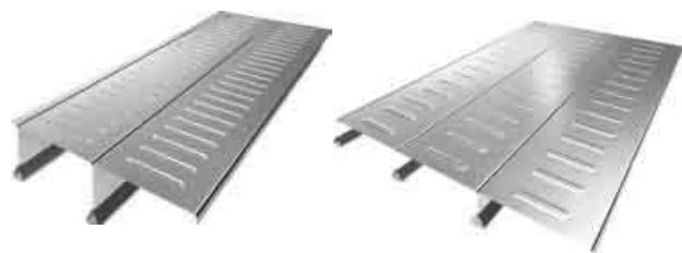
図3 ハイデッキ®100, ハイデッキ®75 Fig.3 HI-Deck 100, HI-Deck 75

上面は平坦で、一般のフラットデッキと同じ特徴をもつ。また、リブ間隔を 210 mm から 200 mm とし、リブ高さを 75 mm から 100 mm としている。さらにスパンの長大化に