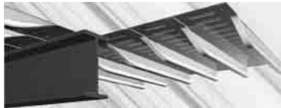
図2 ハイデッキ® リブ部 Fig.2 HI-Deck rib